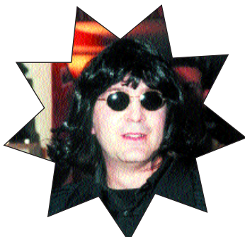
Renato Zero - Rino Argeri

Tra gli svariati cloni di Zero presenti sul mercato è sicuramente il più fedele. Ogni sua serata è sempre una sorpresa. Ha rubato a Renato non solo la voce calda e potente, ma anche parlata romana, scarsa memoria e passione per il trasformismo.