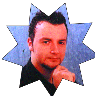
Al Bano - Max Gentile

E' impressionante ascoltare un ragazzo così giovane ripercorrere fedelmente i brani più famosi di una delle colonne della musica italiana. Dotato di una voce che farà tremare tutti il suo repertorio spazia da "Nel sole" a "Tredici dicembre".