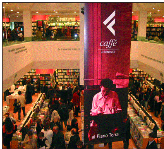
La Feltrinelli di Bari

E per farlo hanno utilizzato una miscela pericolosamente esplosiva, dei compagni d'avventura innamorati presi col gioco e la passione... Paolo Rossi, Daniele Silvestri, Mauro Pagani, Antonello