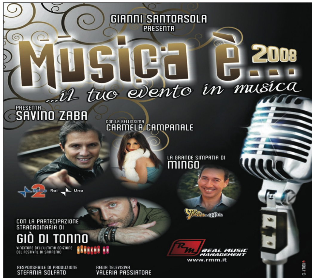
La locandina della manifestazione "Musica è..."

Come ogni anno il casting 2008 ha toccato tutta l'Italia, dal Nord al Sud, costruendo un gruppo di artisti talentuosi e qualificati.