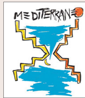
La locandina dell'evento

Editrice presentano Mezzogiorno-Mediterraneo Europa Pensieri imprudenti sull'idea di Italia.